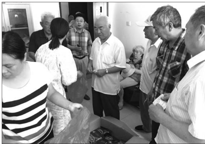
本报推出的保真日照绿受到水城市民的追捧。

没的说,是纯正的日照绿茶,可当他再次来到编辑部希望再买点的时候却发现茶叶早就已经卖完了,为此他懊恼不已,“早知道当时就多买些了,现在市面上虽然有不少卖日照绿茶的,可那些茶叶质量很一般,而且大部分都是南方茶叶炒制的。”