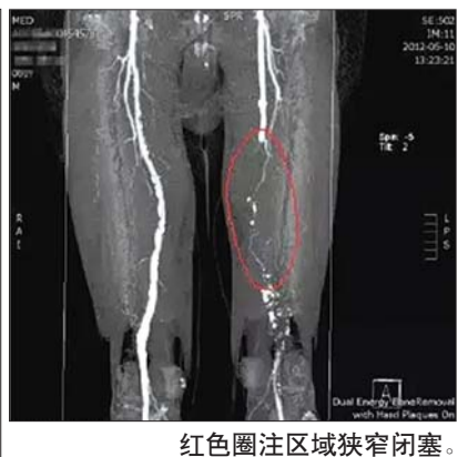
红色圈注区域狭窄闭塞。