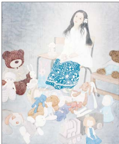
▲小时候 考嘉辉 国画 180X152cm