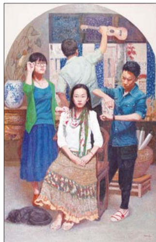
▲状态 杨顺廷 油画 173X265cm