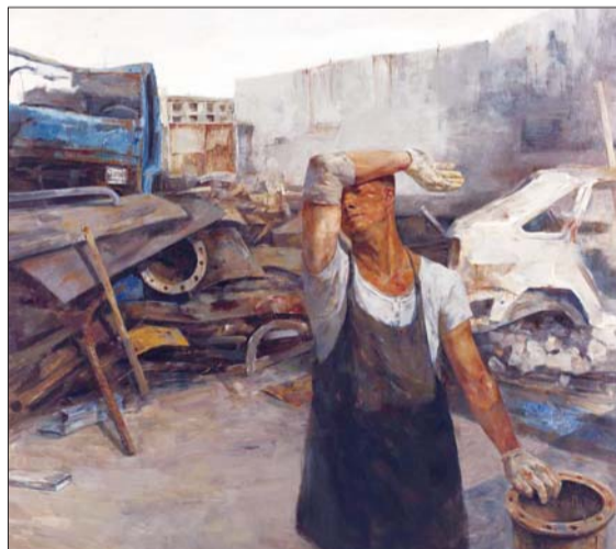
▲古铜 唐博 油画 170X200cm