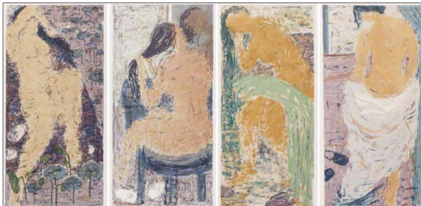
▲夏韵系列 赵园园 版画 70X35cmX4