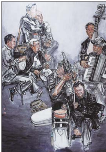
▲沉醉 张浩 国画 170X240cm