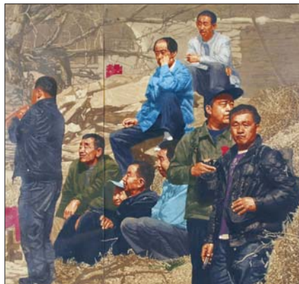
▲聚客 徐宁 版画 120X115cm