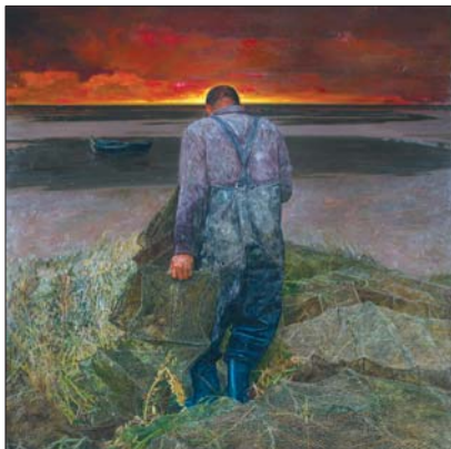
▲父亲的海 于鹏 油画 180X180cm