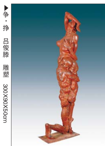
▲争·挣 吕俊滕 雕塑 300X90X50cm