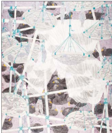
▲春江水暖 梁逸婵 国画 223X183cm