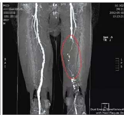
红色圈注区域狭窄闭塞。