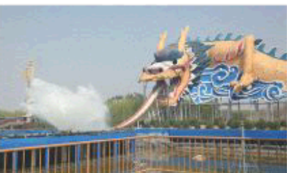
▲清凉刺激的水龙王

心静自然凉，但是城市中的雾霾、高温让人的心境难以平静。太阳部落作为全国首家展现史前文明的特大型文化主题公园，将史前文化、古典文化与游乐项目完