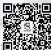
绍兴市旅委官方微信