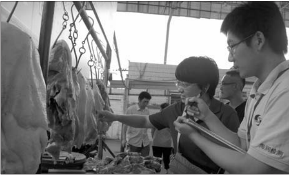
检查人员对市场销售的肉菜等进行抽检。

产品中,有28批次涉及重金属超标。烤鸡翅等4批次烧烤被查出重金属铅超标;油条等20批次早餐食品被查出重金属铝超标;4批次贝类被查出重金属镉超标。还有3批次蔬菜被发现农药残留超标。抽检的100批次熟肉食品中,仅有1批次产品检出