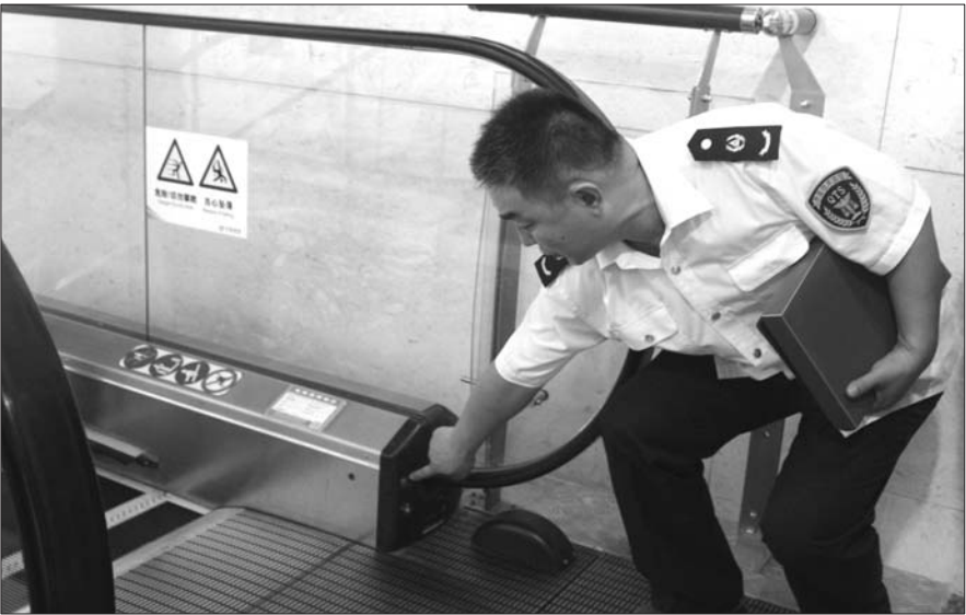
执法人员检查扶梯的应急按钮。

本报济宁7月28日讯(记者 高雯 通讯员 陈帅) 28日,任城区质监局对全区400余台扶梯进行突击检查,在一商场检查时,执法人员发现维保公司提供的扶梯维保记录上没有近一个月的维保信息。 28日下午,走进城区一超市,执法人员发现扶梯两端的梳齿板断齿严重,断齿后梳齿板缝隙增大,衣物、鞋带很容易被卷入其中,孩童的手脚也会有不慎卷入的风险。在维保公司提供的扶梯维保记录上,执法人员发现没有近一个月的维保信息。