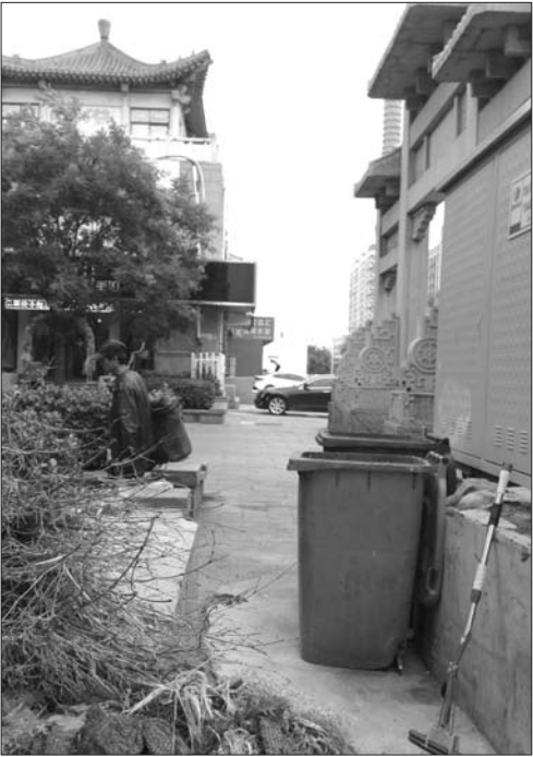
仅有的垃圾箱藏在小角落。

哪里扔垃圾,我们做生意的也不知道了。”通天街一家服装店老板告诉记者,之前通天街还有小垃圾箱,不知道什么时候就没了,现在商户们打扫的垃圾,只能留着关门的时候回家路上找垃圾箱丢,或者到东边小区里的垃圾箱丢。 中午12点,记者在通天街遇到了正在打扫卫生的三位环卫工,环卫工告诉记者,整段道路只有两个垃圾周转桶,在牌坊西边的一个角落里,很多人都不知道。现在环卫工人每天打扫十多次,也不能解决垃圾问题。“主要是没有小垃圾箱,随手就把垃圾扔地上了。”环卫工说,把垃圾箱移到角落是出于街面环境卫生整洁的考虑,希望市民和游客也能体谅打扫卫生的辛苦,尽量不随意丢弃垃圾。