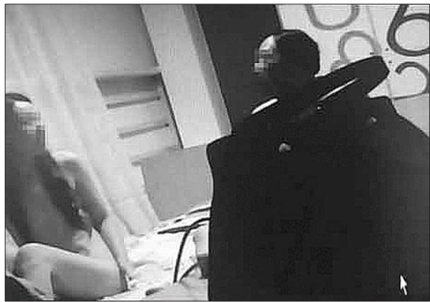
不雅视频截图。据新京报