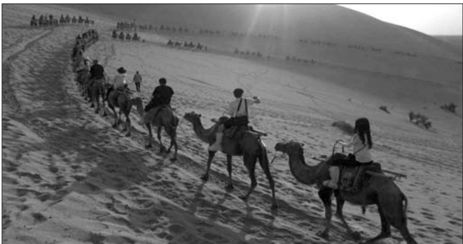
今年暑期火了老少边旅游。

本报济南7月29日讯(记者 乔显佳) 随着大中小学陆续放假,山东旅游市场进入“暑期节奏”。记者29日采访获悉,今年暑期游一大特点是,游客多青睐前往“老少边”地区,像西藏、青海、贵州、甘肃、内蒙古、四川以及东北地区等,目前无论是团队游还是自助游,均十分火爆。