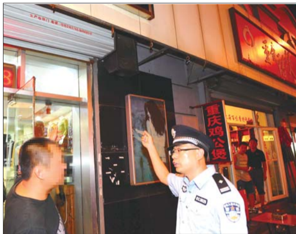
警方针对商家外设音响扰民进行查处。(资料片)

“噪音扰民问题处置不好,影响邻里团结、影响警民关系、影响城市形象。”济南市公安局副局长何志惠称,此次整治的内容主要包含商业经营活动类噪声、公共场所活动类噪声、家庭室内活动类噪声、饲养动物类噪声及其他社会生活噪声等