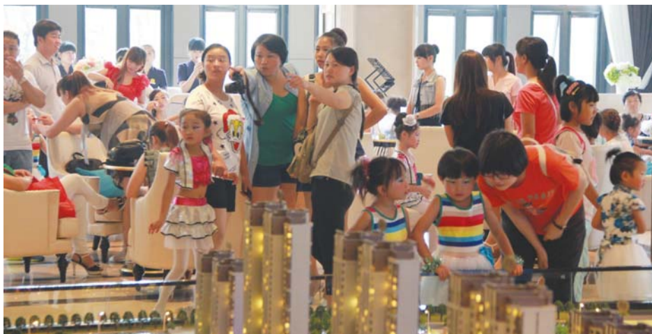
▶绿地城吸引众多购房者关注