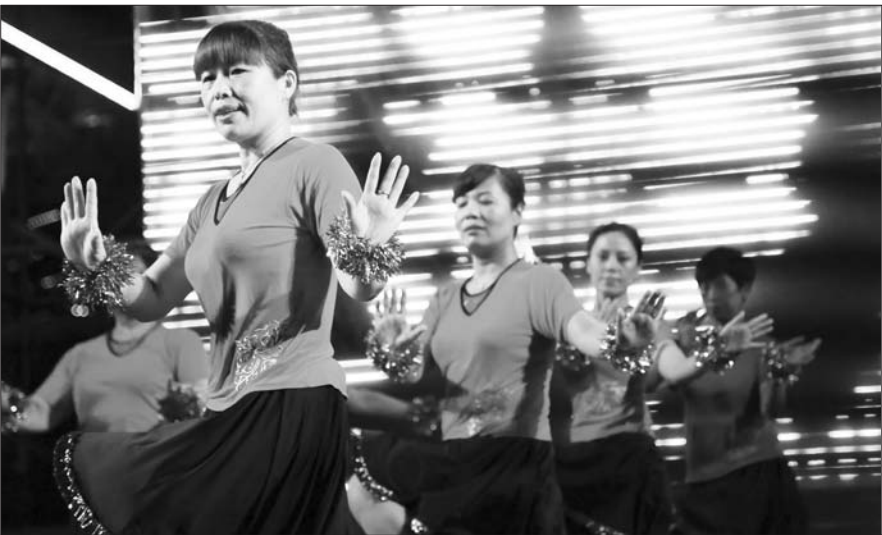
康和新城业主们自发组织,为啤酒节送上热情洋溢的舞蹈。

地窗、飘窗,采光、通风性极佳。 “不仅如此,一楼还赠送私家花园,顶层赠送阁楼;房屋内部配备隔热断桥铝窗、四季沐歌太阳能、高端B级锁等高标准配置,居住比较舒适。现在多层起价仅售6295元/㎡起,产品有极高性价比。”该负责人介绍,希望大家有时间的话,去现场实地看看房子,销售热线是6527777。 本报记者 秦雪丽