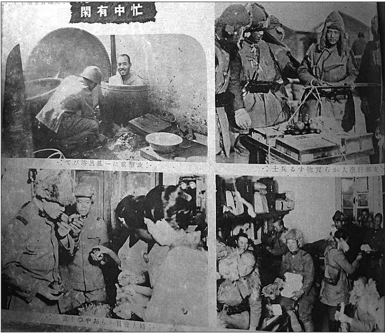
描述日本士兵在打仗间隙的日常(打仗前先泡个澡、买东西、日本妇女给士兵送点心等)。