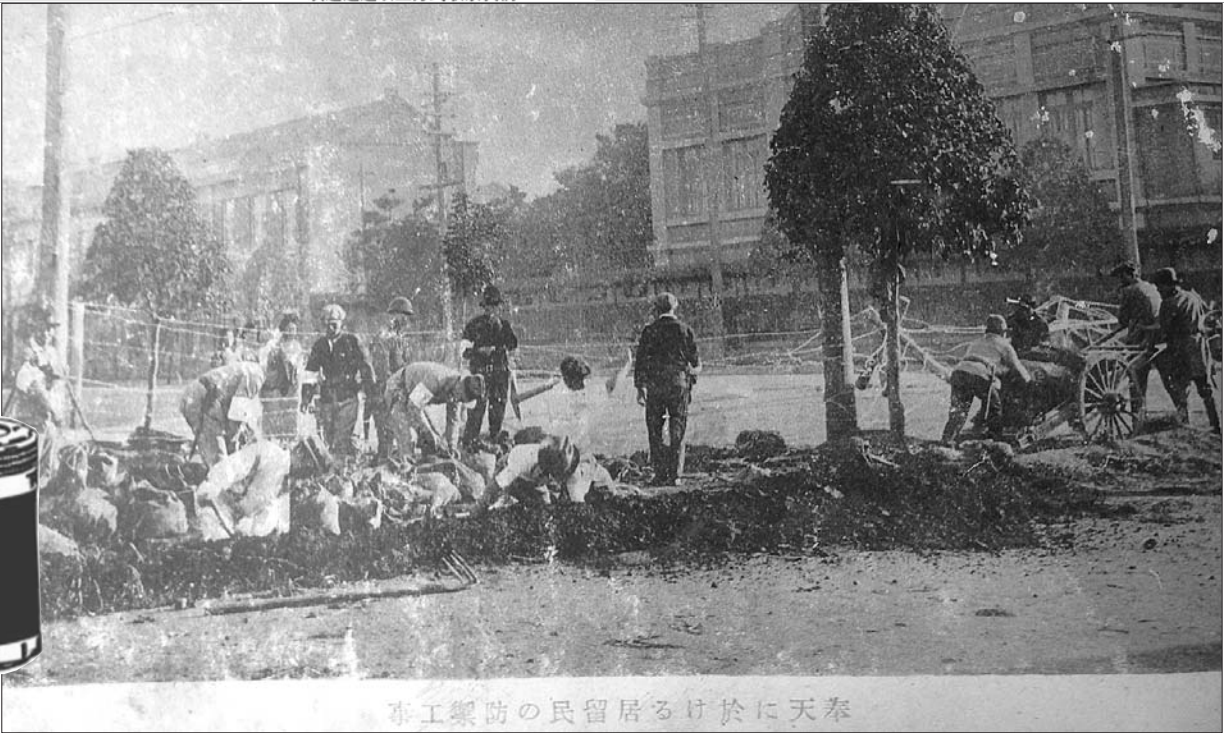
奉天に於ける民衆の防衛工事