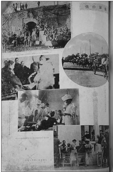
此页的题目叫做“皇军之情”，宣传侵华日军的伪善。