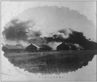
红顶山军营发生火灾。