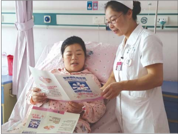
泰安市中心医院产科护士到病房发放母婴喂养手册,并给产妇讲解相关知识。