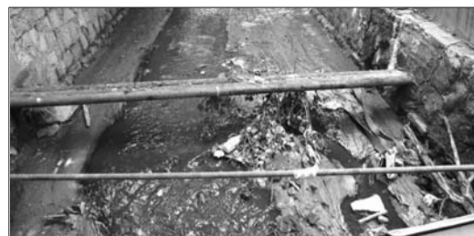
龙脊河在整治前的一段河道。