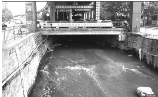
西圩子壕泺源大街段河道被棚盖。

背后,河道被棚子和管道所覆盖,河道之上是两层的活动板房,马家庄西沟已经不见踪影,也看不到由南侧流过来的水去向何方。在兴济河经十路段,也有这种现象。济南市市政公用事业局相关负责人曾介绍,为了治理河道,将65条河道分成了四大分区,大明湖分区恰恰位于济南市中心。在省城的所有河道中,“以市中心的河道棚盖最为严重。”分区内总长度82公里的河道,有28公里被棚盖,占到三成多。