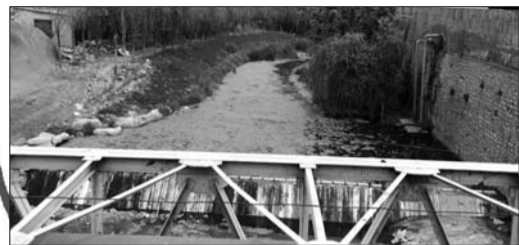
大辛河的一段河道被棚盖。