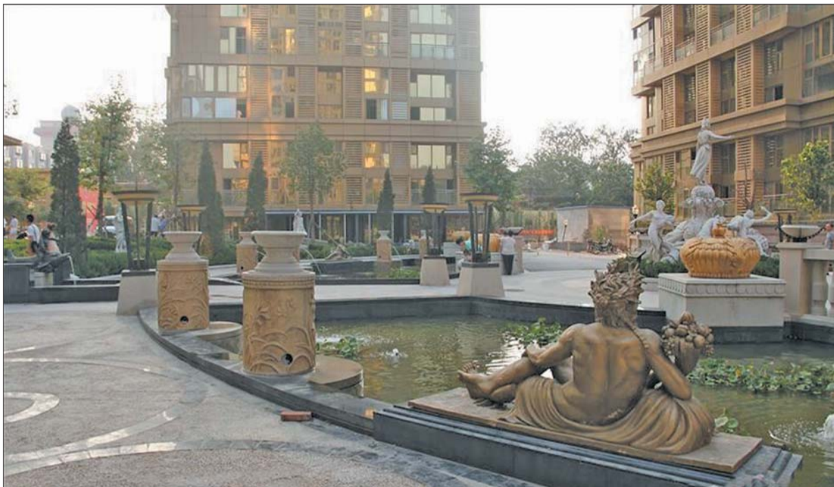
万豪国际小区外景。(资料片)

“一直交着物业费,咋又要收公共能耗费?”万豪国际业主反映,近日物业突然增收每年500元的公共能耗费。物业解释这笔费用是刚需水电费,但业主认为应包含在物业费中。对此,物价部门表示,物业增收费用应征得业主同意。