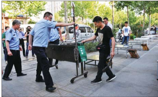
城管人员清理有烟烧烤炉。(资料图)

三包”制度,明确沿街经营业户的责任和义务,引导经营业户自觉保持门前市容环境卫生整洁,自觉保持建筑物门面整洁,自觉保持门头牌匾整洁,充分调动沿街经营业户维护市容环境的积极性,对发现的门前乱停乱放、流动摊点、乱贴乱画等市容市貌问题及时向城管部门反映。