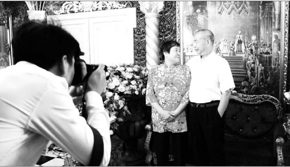
摄影师为老人们拍摄幸福合影。