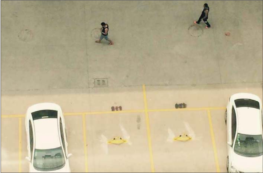
小区内划定的停车位。(网络截图)

然而业主免费停放车辆没几天,下班回家时发现停车位上竟被安装了车位锁,家门口也被贴上了停车位租赁的通知,标明“租期30年,每个车位15000元,一次性交清”。“6日的时候,有业主不满,清除了一个车锁后,招来了开发商的谩骂和威胁,还找了好几个社会青年天天看守这些车位锁。”10日下午5点20分左右,记者在小区看到,除了6号、7号楼是高层以外,其余楼栋皆为多层,在小区主路一侧和两栋高层楼前都划定了停车位,