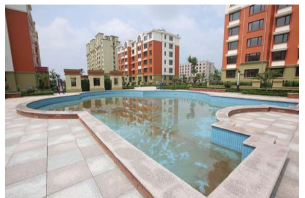
风景宜人的运动员村。

中国象棋项目拟于9月2日-4日在莱西市白鹭湖温泉度假区举办,参赛运动员200人。