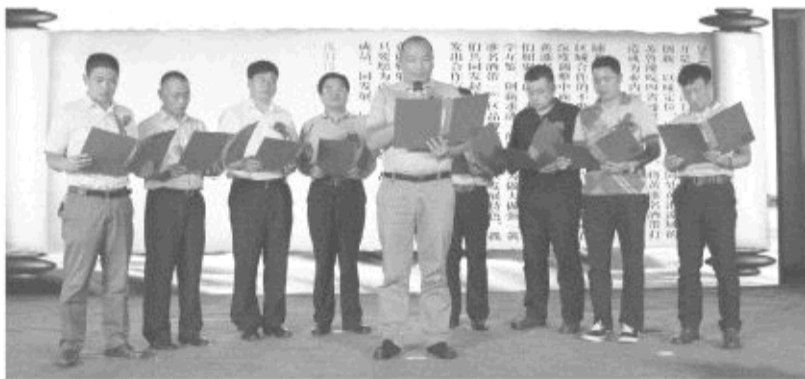
山东花冠、扳倒井、江苏洋河、今世缘、安徽古井贡、口子窖、河南杜康、宋河、仰韶九大中国黄淮名酒发展联盟企业领导宣读联盟宣言

中国黄淮名酒发展联盟成立的宗旨, 是结盟做强“黄淮名酒带”的产区品牌, 打造独特产区风格, 提升产区影响力。通过这个联盟, 可以明确“黄淮名酒带”生态酿造的优势, 比如黄淮名酒带的生态条件, 更适合酿造什么样的白酒, 又该怎样加以保护和建设, 如何从中提炼出优美的文化意象。