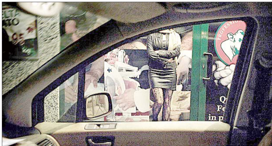
意大利街头的性工作者。