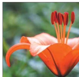
▲二等奖 作者 韩宇晨 奖励价值300元奖品