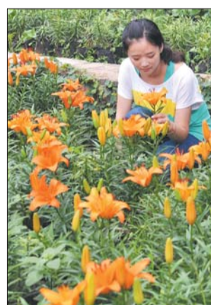
▲三等奖 作者 耿逸冰 奖励价值150元奖品