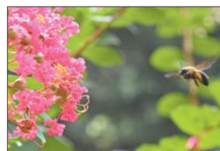
▲三等奖 作者 于歌 奖励价值150元奖品