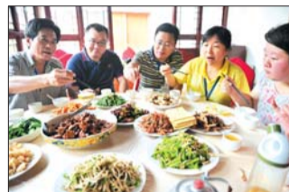
▲炒鸡、红烧肉、虾仁、秋葵……好吃!