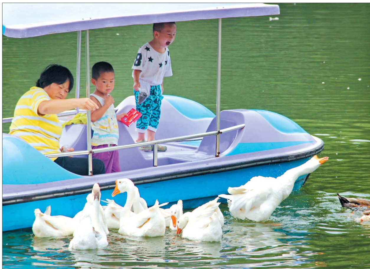
▲一等奖 作者 方晓露 奖励价值500元奖品