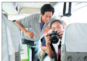
▲行驶的车上也不忘学习。