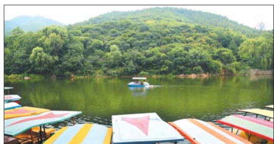
▶三等奖 作者 李正新 奖励价值150元奖品