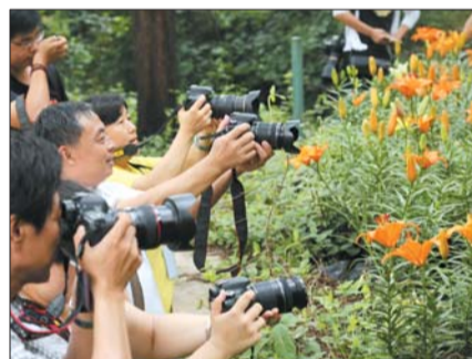
▶三等奖 作者 董洪波 奖励价值150元奖品

齐鲁晚报艺术培训中心 咨询电话:400-158-6585 学校网址: http://pxzx.qjwb.com.cn 地址:山东省济南市经十路12111号中润世纪城三期1号楼4层(山东省武警医院南邻)