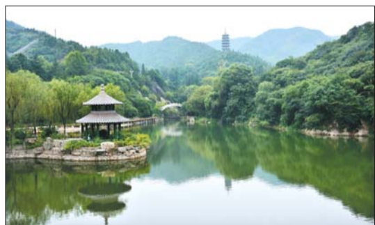
▶二等奖 作者 郑晓革 奖励价值300元奖品