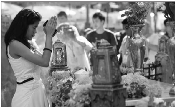
8月19日,一名妇女在四面佛神庙参拜。

巴武19日用“白客”一词描述这名“黄衣男子”的相貌特征。“白客”是泰语中对部分外来人群的统称,中性词,可简单理解为,肤色较泰国人白的人群,或者有白色头饰的人群,有非佛教宗教背景的人群。