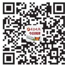
齐鲁晚报今日菏泽 官方微信二维码

一位参加联谊会的女子告诉记者,这是她第一次参加这样正式的联谊活动,有点紧张,但也很希望能找到自己的另一半。记者了解到,由于职业关系,此次参加活动的教师、护士较多,现场男女比例大概为3比7。