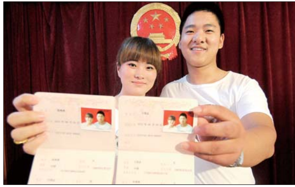
一对新人在七夕情人节领取结婚证。

邢玉玲告诉记者,像七夕、520等日子,每年都是结婚登记扎堆的日子。“基本上每年这样的日子,结婚登记的市民都能达到200对左右,比平常的工作日登记人数多