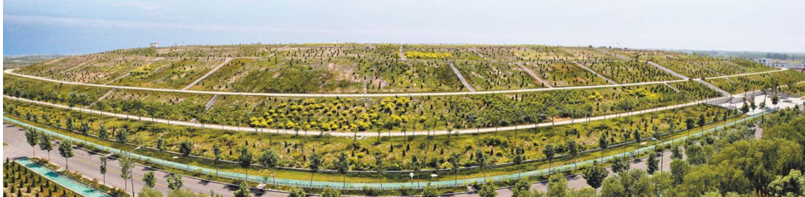
▼济阳的垃圾填埋一厂垃圾山已经变身为公园。（资料片）

经过绿化、景观建设后变身为美丽的公园。等将来二厂封厂后，便便的填埋地或许也会变身成美丽的公园。