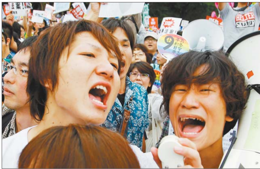
30日,在日本东京国会大厦附近,民众在反安保法案抗议集会上呼喊口号。