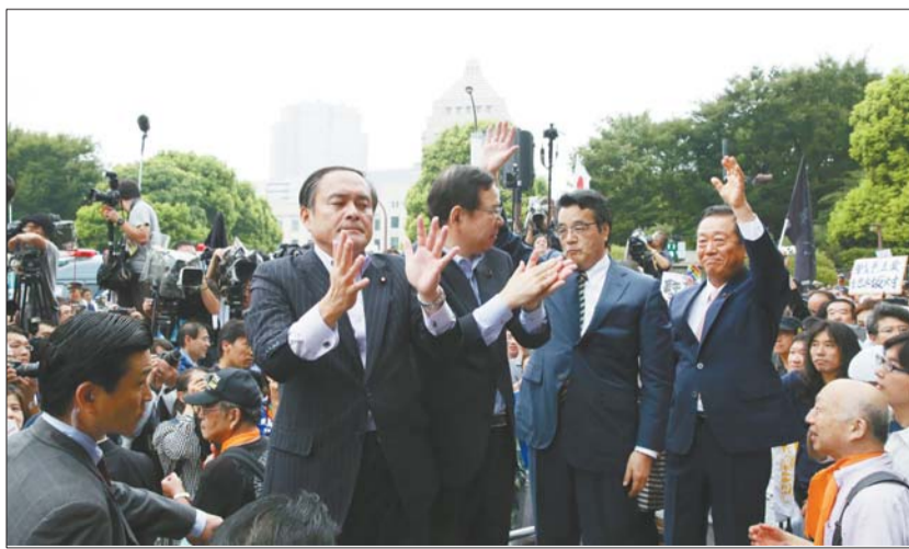
30日,吉田忠智、志位和夫、冈田克也、小泽一郎(中间从左至右)等日本在野党党首在集会上发表演说。