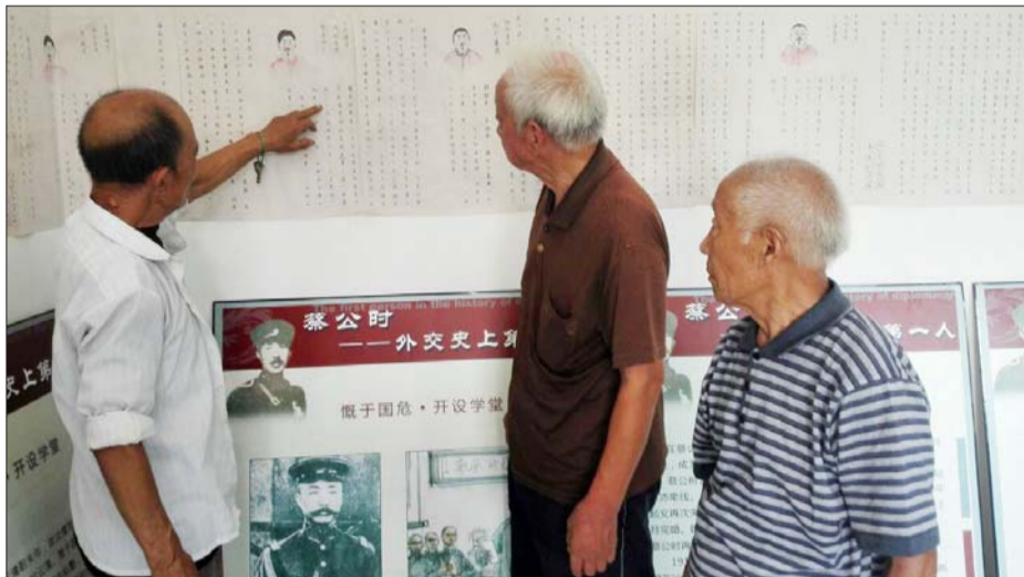
三位老人向村民们讲解抗日战争时期的事情。