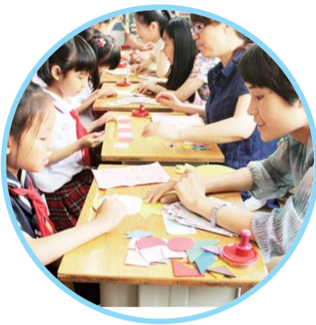
新学期开始了,小学老师中,“阴盛阳衰”依旧,鲜见男老师身影。(资料片)