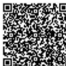
扫描二维码 直接进入游戏页面