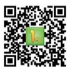
扫描二维码 下载最新版“壹点”APP

一起闯关答题领取红包,了解你是不是真的熟悉山东的抗战历史,看看你能获得什么评价吧!