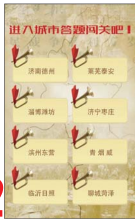
2 一共八个战区,选择城市答题