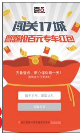
3 获得红包后,别忘了分享游戏哦