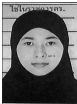
泰国警方新锁定的泰国女性嫌疑人。