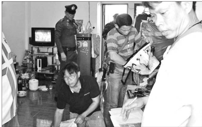
8月30日,泰国警方在泰国曼谷东北部的明武里地区对一处公寓进行搜查。

目前,这些证据均被送往法医鉴定科,以辨别其与四面佛和沙吞爆炸案所使用爆炸物之间的关系。