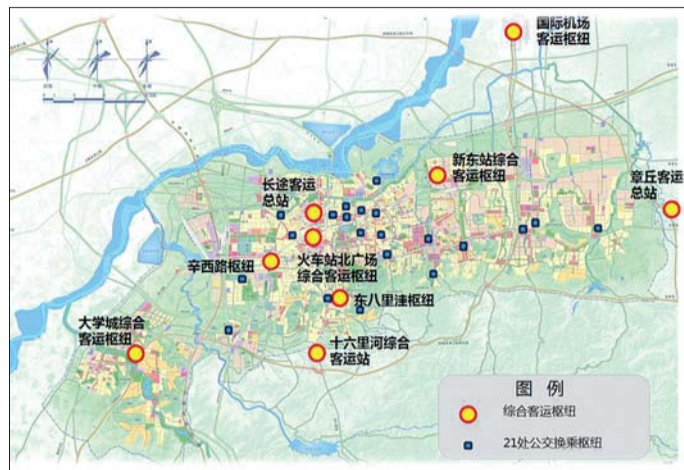
十大综合客运枢纽