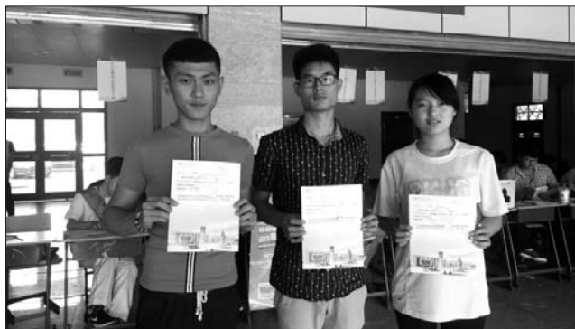
越来越多的考生选择职业教育,图为三名外地来烟台求学的新生报到现场展示自己的录取通知书。

另外,高考实行平行志愿后,更多的考生会选择冲击经济发达地区的高校。沿海地区的高校直接受益,烟台高校基本都超额完成计划,而且分数都很高,最低分平均接近400分,沿海地区经济发达,就业机会多,成为很多家长和考生报考的重要考虑指标。