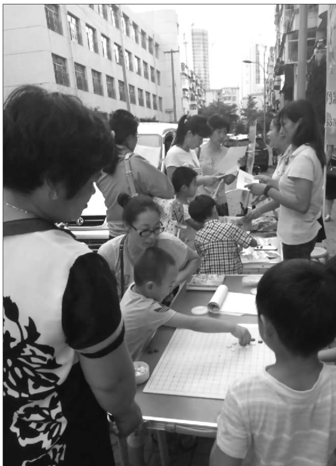
【活动报道】“我和妈妈学围棋”走进社区图片