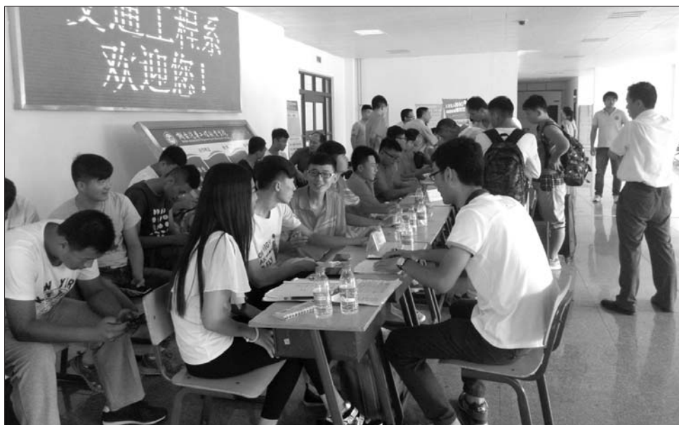
没开学新生就报到过半,正式报到当天报到现场略显冷清。

“国家重视了,家长认可了,关键还是要看学校育人质量好不好。”学院院长尹桂瓚说,“无论是学文化还是学技能,关键是