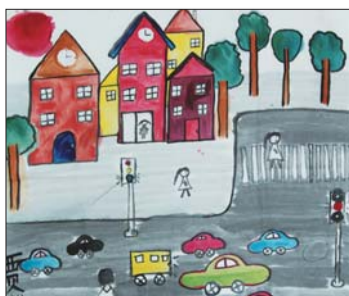
《文明交通》 贾甜语 北镇小学