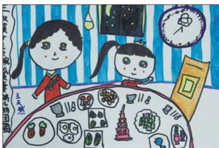
《三只筷子三只碗,爱妻娇儿盼团圆》 王天然 一小