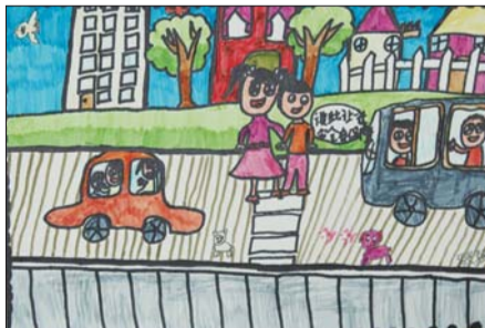
《平安交通你我他》 吴思瑶 胜利十五中