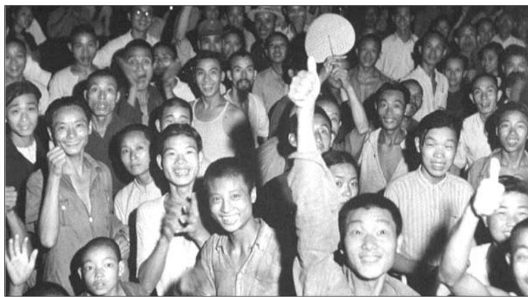
重庆人民欢庆胜利。(资料片)

1945年9月3日为陪都重庆庆祝胜利降临的第一日,在八年里遭受过数次轰炸,一直神经紧绷的重庆,在那时已经变成一座狂欢的都市。由于街头巷尾人群拥挤,城市交通一度断绝六小时。