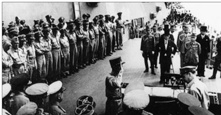
日本代表准备在投降书上签字。(资料片)

1945年9月2日上午9时,日本投降仪式在东京湾的美国战列舰“密苏里”号上举行。日本外相重光葵代表日本天皇和政府,陆军参谋总长梅津美治郎代表“帝国”大本营在投降书上签字。而在签字仪式上,也发生了很多不为人知的故事。一些签字过程及其背后的细节,也会勾起人们对那个胜利时刻的回忆。