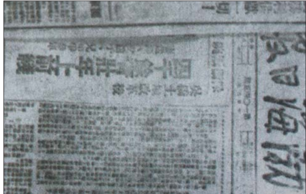
《渤海日报》刊登的有关大参军运动的消息。

8月15日,日本宣布投降,于同年底,渤海日报机关和印刷厂跟随渤海区首脑机关,进行3次大搬迁,向惠民城进发。五六辆老牛车,拉着机器设备,咣当咣当,从高庙李出发,当天晚上就赶到滨城西关庙里过夜,于第二天掌灯时分赶到惠民城。不到半年时间,印刷厂三次大搬迁,三次大转移,为了确保按时出报,每次大的转移,一般都采取分批搬迁,或者派先遣部队提前行动,或留少数人坚持原地生产,争分夺秒,有时连轴转,把登载抗日胜利喜讯的报纸印出来,发送到抗日军民手中。