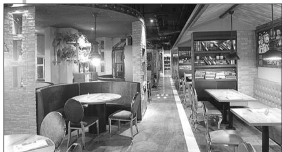
位于济南文化西路上的一家餐厅,便是由废弃的工业厂房改造而成。(资料片)

夫妻二人不吃不喝,要 9.1 年才买得起一套按平均价格算100平米的房子。(注:按照山东城镇居民年人均可支配收入入29222元计算)