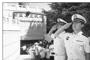
中国首个钓鱼岛主权馆开馆。

目前,展馆内主要陈列的是历史资料和图片等,详细展示了钓鱼岛及其附属岛屿自古就是我国固有领土的历史和法理依据。刘公岛管委会相关负责人表示,今后场馆将逐步增加多媒体、影视、互动环节,同时不断增加藏品,并希望收藏此前保钓人士用过的物品。