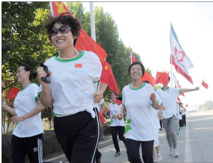
“红”动菏泽,爱我中华,50余名市民跑出了精气神。

未来20余天,这项活动将走进菏泽十县区。每次活动的起始点均为革命圣地。主办方旨在通过系列活动激发市民爱国热情和体育锻炼兴趣,提醒大家热爱祖国、关注身心健康。9日爱国跑将在巨野开跑,上午8点集合,将从巨野英雄广场跑到齐鲁会盟台,也期待读者您的共同参与。