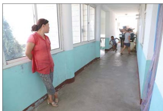
课间活动,也只有两个孩子玩耍。