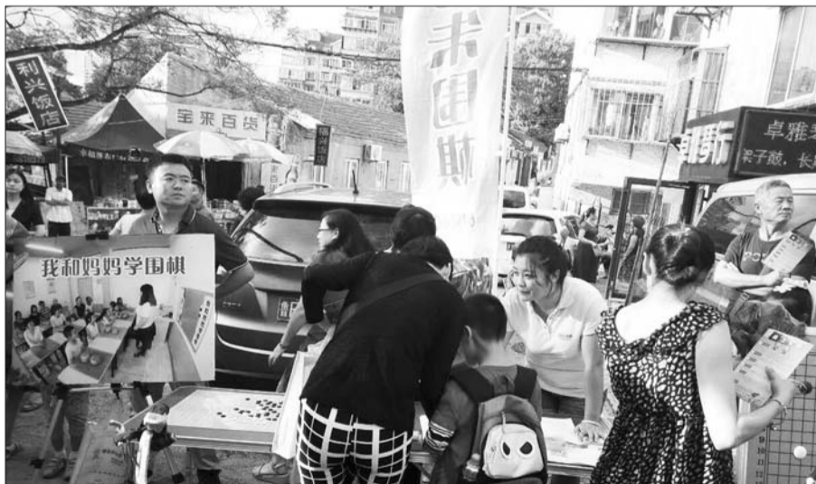
“我和妈妈学围棋”活动,走进东山社区图片