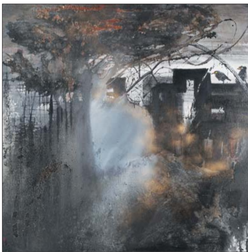
邹明《醒》综合材料 200X200cm 2015