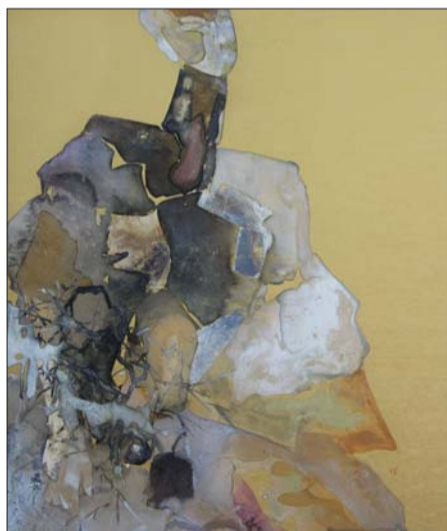
杨洋《霓裳·枝》综合材料 79X67cm 2015