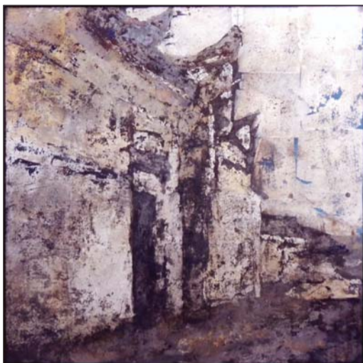
余力茵《辛亥旧址》-2 综合材料 60X60cm 2012

参展艺术家(按年龄排序):邹明、宋卫东、刘彦、余力茵、孙小娥、汤志义、秦仁强、杨洋、王玉华、周璐