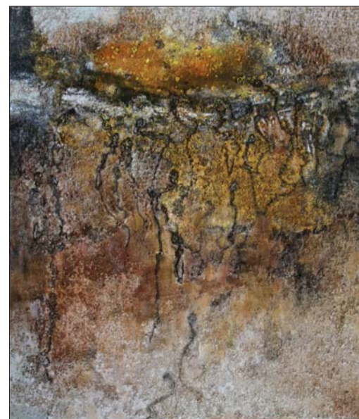
刘彦《流年之十六》综合材料140X120cm 2013