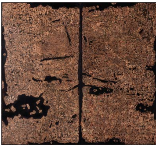
汤志义《时间的尘埃》综合材料 200X180cm 2015