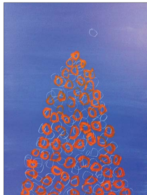
孙小娥《关于秋—圆》综合材料 100X80cm 2014