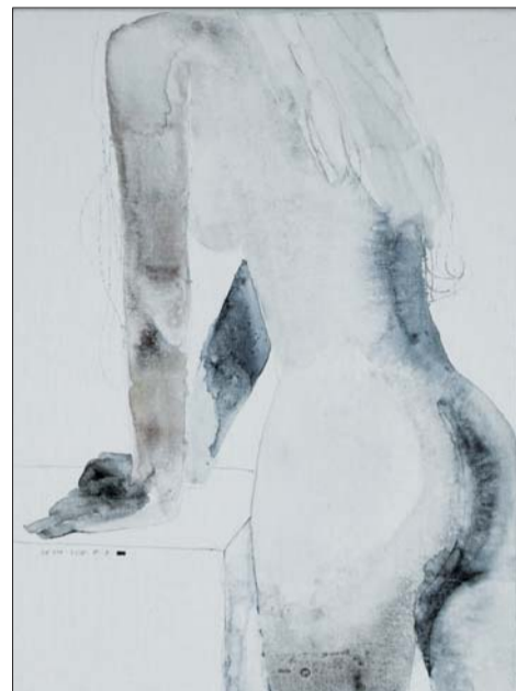
王玉华《和其光》系列 综合材料65x85cm 2015