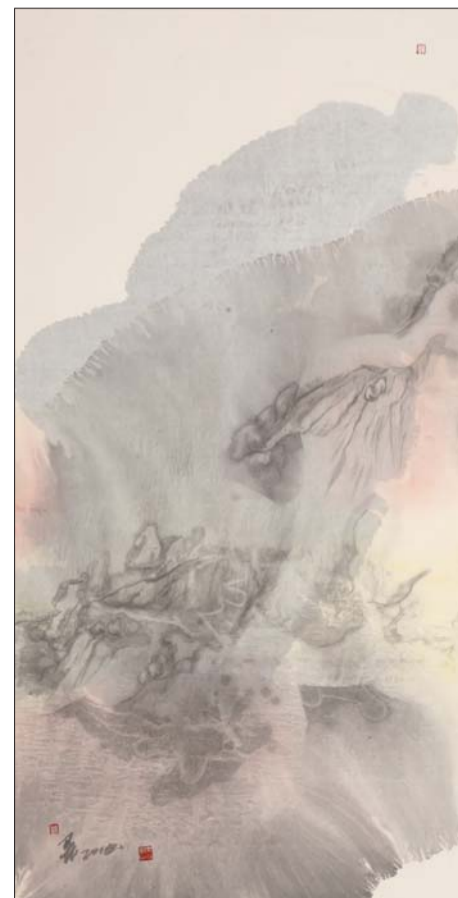
宋卫东《彩云之间》2 综合材料 136X68cm 2015