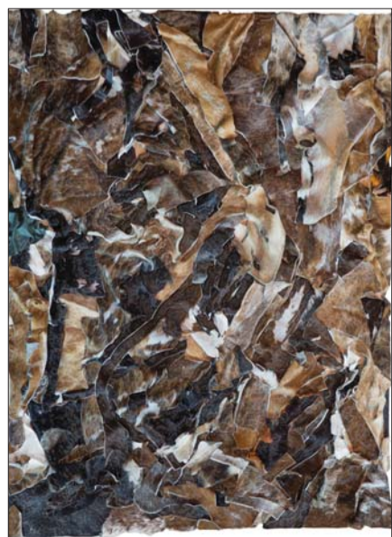
秦仁强《忆如歌》综合材料 90X120cm 2015