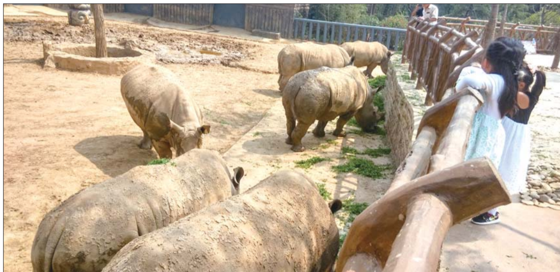
◀章丘野生动物世界内的白犀牛。

园区的动物笼舍,为了保证游客和动物安全设置的壕沟、电网等已经完工。据工作人员介绍,这个园区是按照5A级标准进行建设的,“在北方属于领先水平。”记者看到,仍有不少工人在抓紧施工,“整个园区的工程量已经完成了95%,目前正在进行生态餐厅、生态体验馆、游览车站、公厕等设施的收尾工作,9月20日之前具备使用条件,园区将于‘十一’左右试运营。”