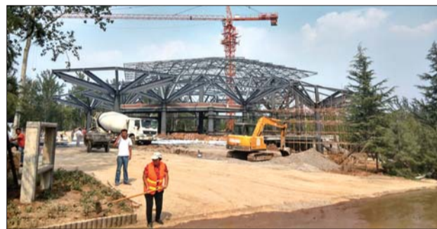
正在抓紧建设的室内马戏表演馆。