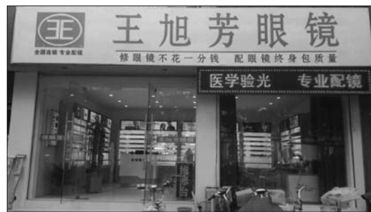
新泰三店:0538—7214977 (新泰市东周路市医院对过)