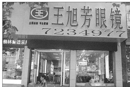
新泰一店:0538—7234977 (平阳路银座东方时代广场斜对过)