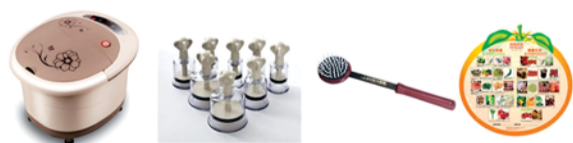
图片仅供参考，最终以实物为准。

参与方式：下载注册平安人寿APP，登陆活动专区，选择“读报有奖活动”点击“我要参加活动”即可参与。