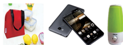
图片仅供展示，最终以实物为准。