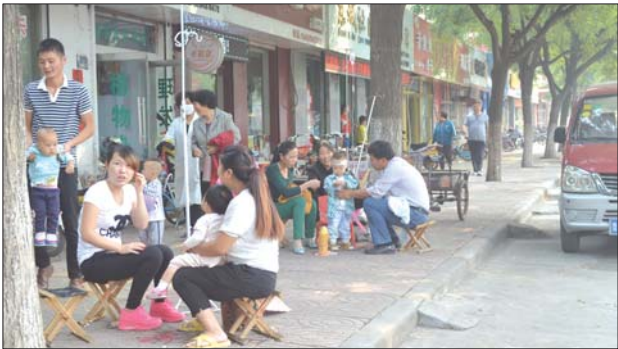
输液室坐不开,市民在门口打针。

本报新泰9月17日讯(实习记者 巩克通) 由于夏秋季节更替,每日早中晚温差较大,感冒发烧的患者多了不少,而且多以孩子为主。有的诊所一天能接治六七十个