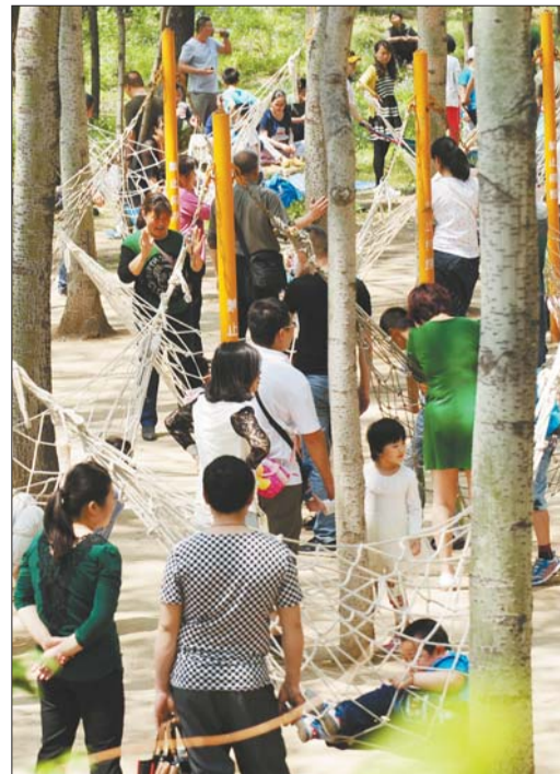
位于章丘的济南植物园吸引了大量游客。

济南市旅游局相关负责人也告诉记者,野生动物世界东迁是济南市经过科学论证作出的决策,“有利于整合旅游资源,形成济南多日游的格局,有利于推动济南逐步转变为旅游休闲的目的地。”