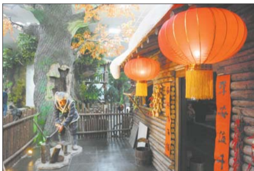
朱家峪景区。

山东国信国际旅行社有限公司董事长张晓国认为,野生动物世界是一种特色鲜明的旅游景点,“有着观赏、科普、互动等三大功能。”其中科普、互动等功能会吸引大量亲子游,与其他景区差异化较为明显。