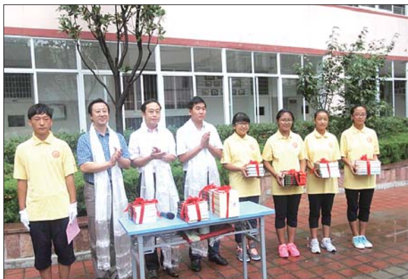
新学期开学,向学生赠书。