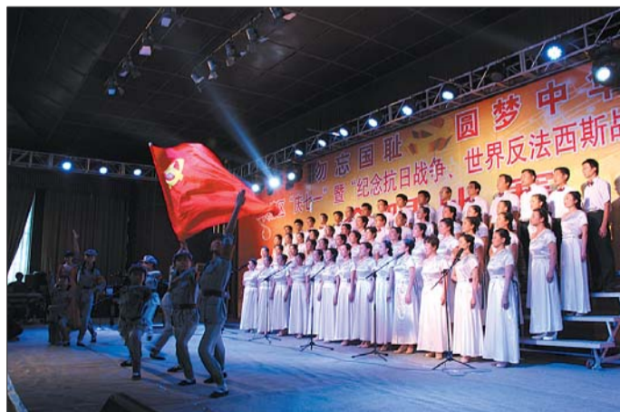
2015庆“七一”暨纪念抗日战争、世界反法西斯战争胜利70周年合唱比赛