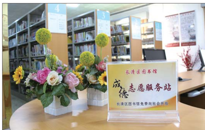
长清区图书馆一角