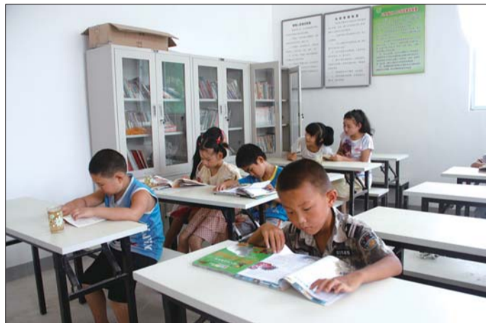
万德镇玉皇庙村留守儿童在村文化大院图书室看书。

让服务方式“活”起来是该区文化馆的另一发力点。该馆坚持城乡文化一体化的理念,借鉴军民共建、城乡结对等模式,促进城市现代文明向农村辐射,文体设施向农村延伸,文化服务向农村拓展,通过经常性地开展文化下乡、广场文化节、文化常驻村等活动,为群众提供丰盛的“文化大餐”、“文化盛宴”。济南市豫剧团、高跷秧歌队、曲艺说唱团、武术团队、庙会表演等本土文化队伍长期活跃在农村,形成了传统特色文化品牌,在农村中发挥着不可低估的作用。文化馆紧紧瞄准这一庞大的文艺队伍,对这些“乡土文化”、“草根文化”持续扶持,并大力发掘、培养文化骨干,为农村培育出一支永不带走的“乡土艺术家”。