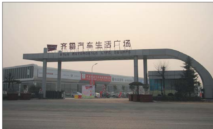
大众报业齐鲁汽车生活广场