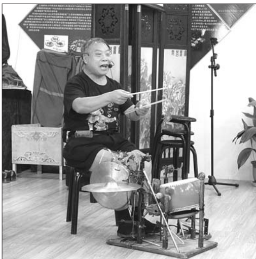
在山东非物质文化遗产老一辈传承艺人聚会上展示“十不闲”绝技。